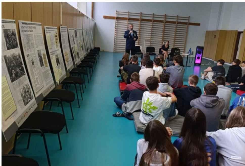
Záber z besedy v nitrianskej škole

Na základnej škole v Nitre sa v septembri uskutočnila aktivita pre žiakov, kde bola prezentovaná “dôležitosť mieru a skúsenosti z vojenských misií” bývalého príslušníka ozbrojených síl SR. Súčasťou podujatia bola aj výstava venovaná 80. výročiu SNP, ktorú pripravilo občianske združenie Slavica, a ktorá bola zneužitá na proruskú propagandu. Združenie Slavica sa prezentuje ako združenie, ktoré sa zaoberá históriou slovanstva a Slovenska. Vo svojich príspevkoch však prezentuje rôzne konšpiračné teórie, ako napríklad teóriu o stále prebiehajúcej genocíde Slovanov. Jeho zakladateľ bol súčasťou návštevy v Moskve, kde sa stretol so zástupcami média Sputnik, ktoré bolo Európskou úniou zaradené na sankčný zoznam z dôvodu šírenia dezinformácií a manipulácie informácií.