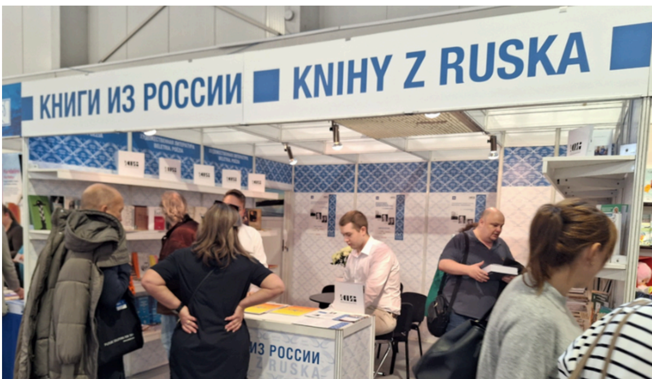
Snímok príspevku na sociálnej sieti facebook o otvorení stánku Knihy z Ruska

V roku 2024 pokračovala ruská ambasáda v nenápadnom ovplyvňovaní verejnej mienky na Slovensku prostredníctvom tzv. mäkkého vplyvu. Príkladom bola ponuka pre blogerov, ktorí sa venujú vzdelávacím alebo politickým témam a majú možnosť cestovať po Rusku. Veľvyslanectvo takisto propagovalo účasť na konferenciách a vzdelávacích pobytoch v Rusku, určených nielen pre študentov, ale aj pre mladých diplomatov a úradníkov. Ruská ambasáda tiež organizovala prednášky v Ruskom dome v Bratislave a návštevy veľvyslanca na vzdelávacích inštitúciách po celom Slovensku. Počas knižného veľtrhu v Bratislave sa uskutočnilo slávnostné otvorenie stánku „Knihy z Ruska“, na ktorom sa zúčastnili významní predstavitelia vrátane veľvyslanca I. Bratčíkova a osobitného predstaviteľa prezidenta Ruskej federácie pre medzinárodnú kultúrnu spoluprácu M. Švydkého. Medzi spoluorganizátormi stánku bol aj Prekladateľský inštitút (Institút preвода) so sídlom v Moskve, ktorého zakladateľom je aj ruská propagandistická televízia Russia Today. Účasť tohto inštitútu bola priamo podporená ruským ministerstvom digitálneho rozvoja, spojov a masmédií.