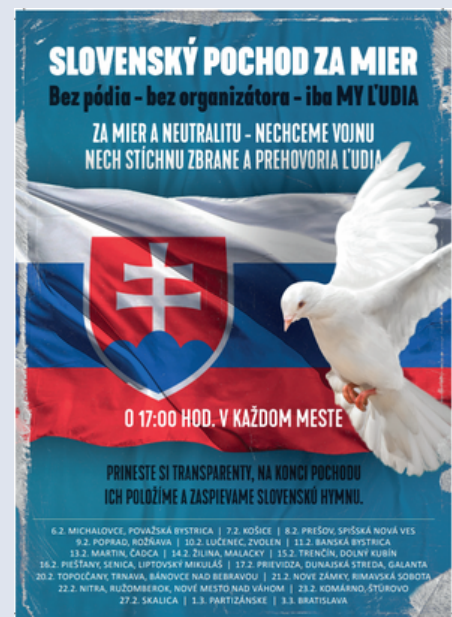
Snímka z webovej stránky občianskeho združenia Archa, https://spolok-archa.info/slovensky-pochod-za-mier-2024-pokyny-a-informacie/

Tento spolok je jedným z hlavných organizátorov aj pochodov avizovaných v termínoch od 11.10. až 17.11.2024 a preto aj na týchto pochodoch očakávame prejavy prorúskej propagandy.