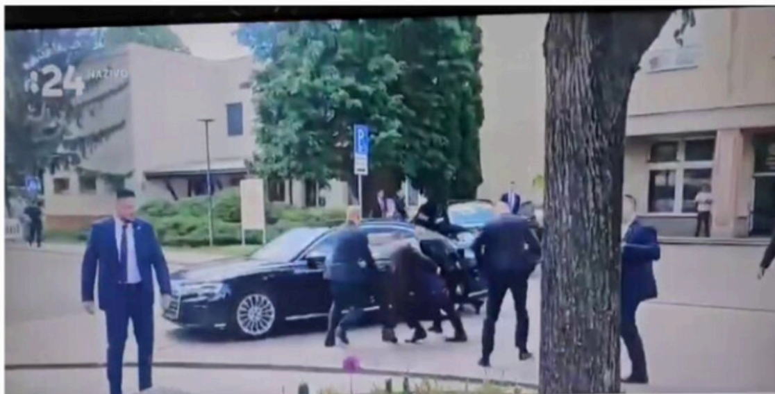
Snímka článku zo 16.5.2024, v ktorom sa objavujú teórie spochybňujúce atentát